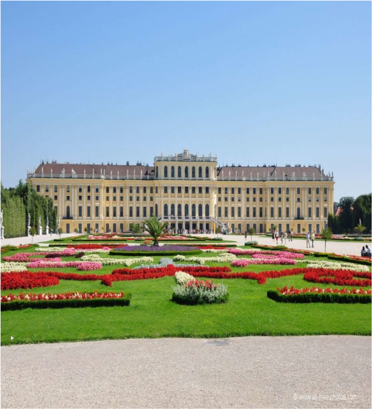
Βιέννη - Δάση Βιέννης, Μάγιερλινγκ,