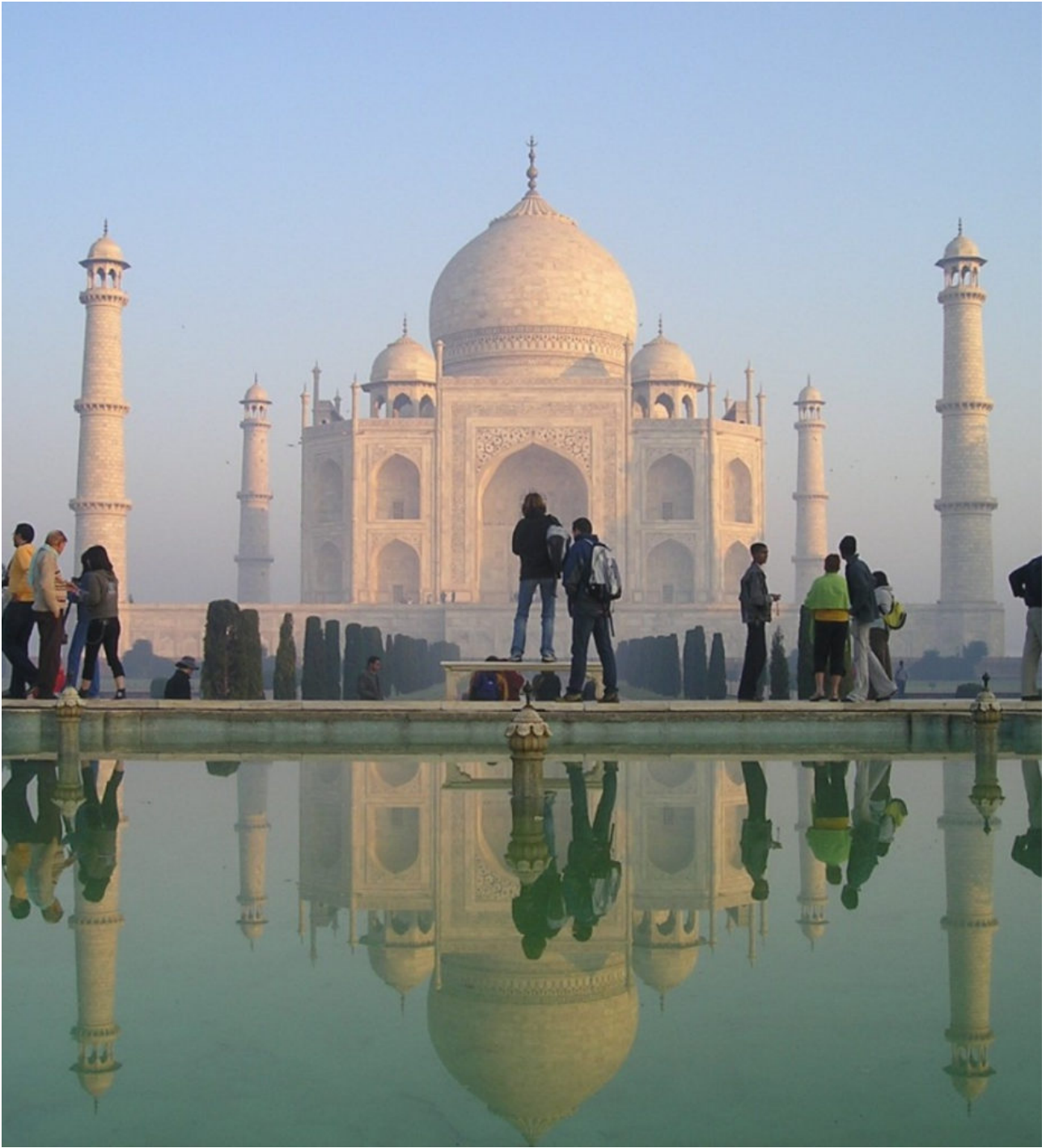
Πανόραμα Βόρειας Ινδίας, Βαρανάσι,