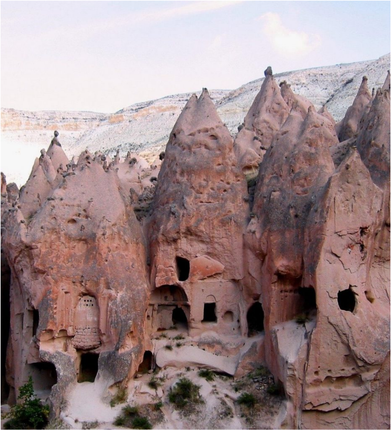
Καππαδοκία, Μικρασιατικά παράλια