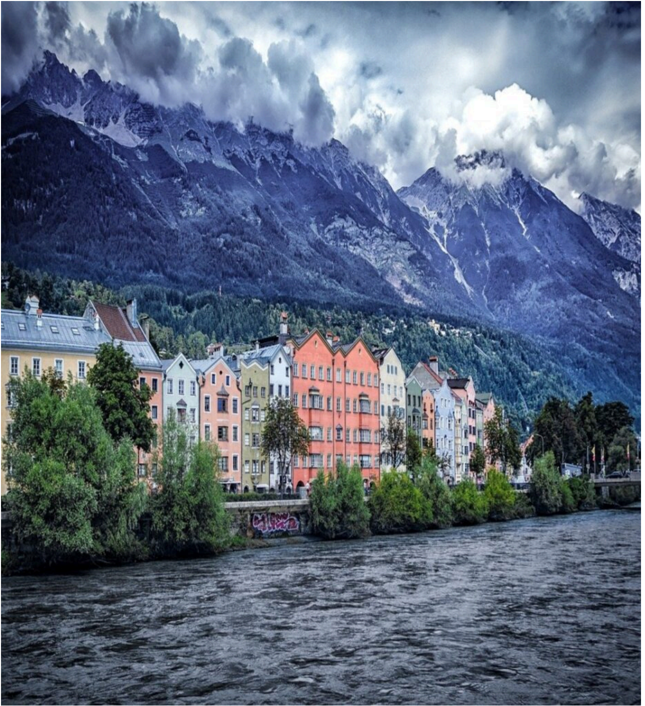
Αυστριακό Τιρόλο - Βαυαρικές Άλπεις